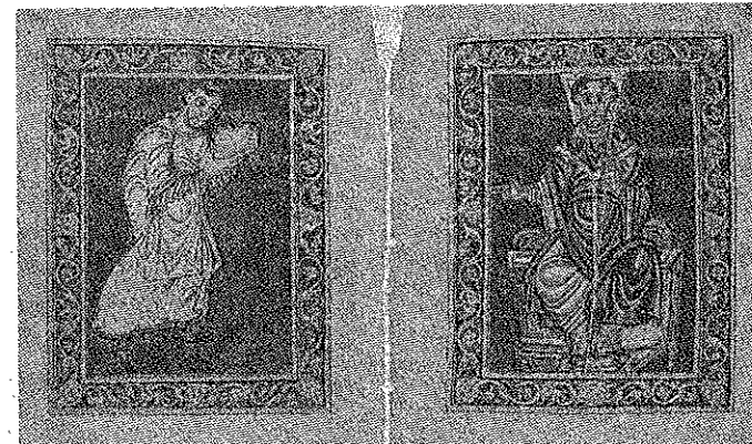
Dal “Salterio di Egberto” (Cividale, Museo Archeologico Nazionale)

Il “noi” abbraccia il nutrito staff di esperti – reclutati nel segno della multidisciplinarietà: elemento, questo, di rottura rispetto ad analoghe fatiche pregresse – che sotto la guida, appunto, di Cesare Scalon ha prodotto il volume I libri dei patriarchi. Un percorso nella cultura scritta del Friuli medievale , tomo monumentale, edito dallo stesso Istituto Paschini e dalla Deputazione di Storia Patria del Friuli presieduta da Giuseppe Bergamini, che si prefigge l'ambizioso obiettivo di conciliare accuratezza d'indagine